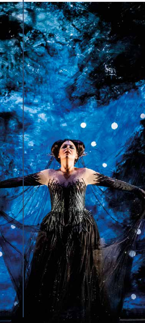
"La flûte enchantée" au CGR Châteauroux