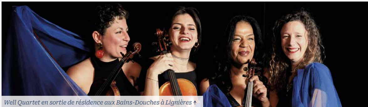
Well Quartet en sortie de résidence aux Bains-Douches à Lignières ↑