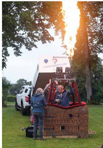
Derniers réglages pour cet équipage venu du Nord de la France.