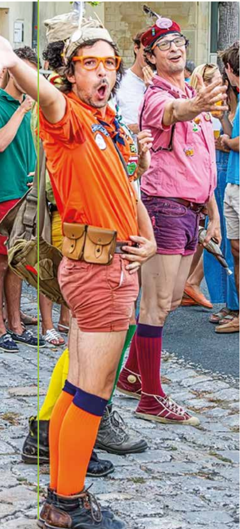
Ambiance garantie aux Lyelliputiennes ✎

«Fêtes de Saint-Chartier» Romain Chéré & Zsofi Varkonyi / 15h / Le P'tit bonheur - Saint-Chartier / Gratuit