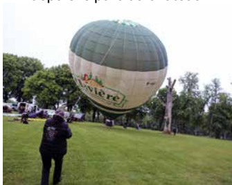
Départ imminent pour un concurrent du Trophée.