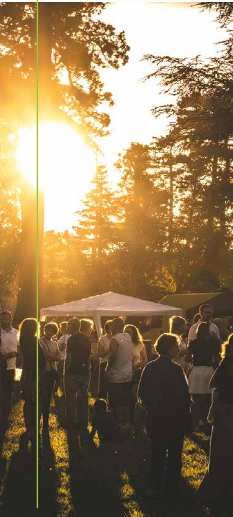
Juin : le retour des marchés gourmands ▶

«Journée de l'escrime» initiation, animations / 10h / Stade de Beaulieu - Châteauroux / Gratuit