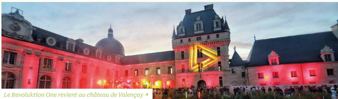
Le Revoluktion One revient au château de Valençay ↗