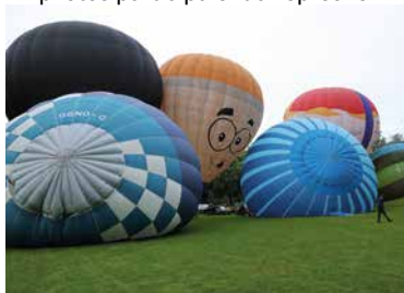
À l'heure du départ, c'est la bousculade chez les participants.