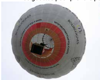
Envol d'un ballon concurrent depuis le parc du château.