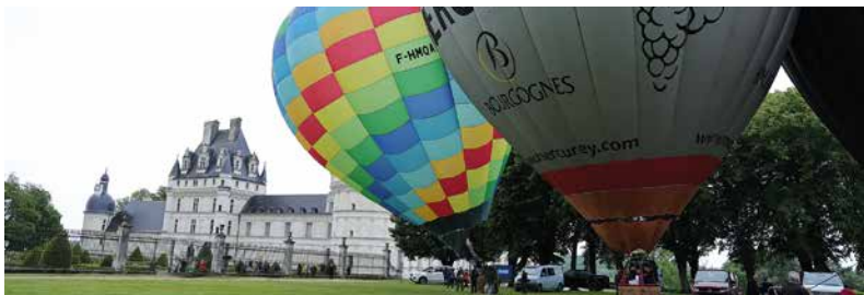
Le 19 mai s'annonçait pluvieux : les montgolfières sont pourtant passées entre les gouttes pour prendre part à la 3 e édition du concours valencéen.