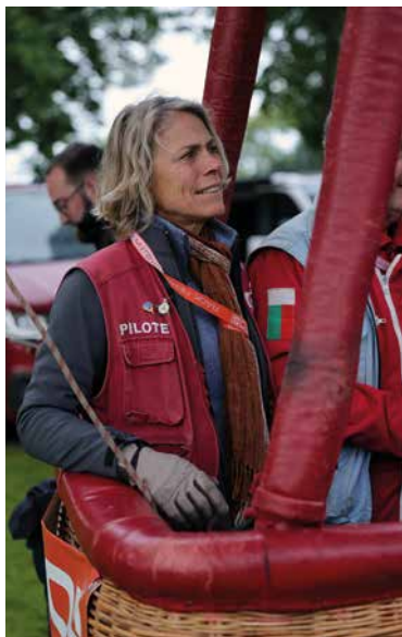
Une vingtaine de ballons et donc de pilotes participaient à l'épreuve.

Les montgolfières du Trophée François 1 er se sont envolées du château de Valençay.